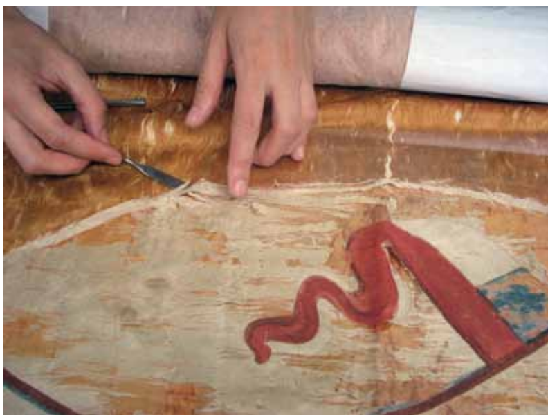
Foto 10. Detalle de retiro del escudo de la faz A, luego de haber retirado restauraciones anteriores.

Para la consolidación se preparó una crepelina para cada escudo de 70 cm x 75 cm, teñida con anterioridad en el mismo tono del escudo. Ésta se dispuso sobre un mylar y se impregnó con mezcla adhesiva mediante el uso de brocha y rodillo, dejando secar por 3 horas, luego de las cuales se formó una lámina adhesiva. Una vez seca, esta lámina se despegó del mylar. A continuación, se depositó el escudo sobre la lámina adhesiva y se ordenó sobre ésta. Luego, por el derecho del escudo,