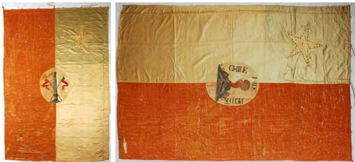
Foto 1. Faz A y Faz B, antes de la restauración.