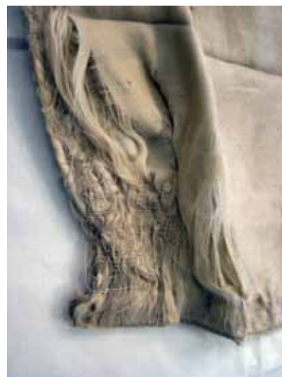
Foto 4. Detalle del escudo de la faz A donde se observan áreas de faltantes y costuras de la restauración anterior.