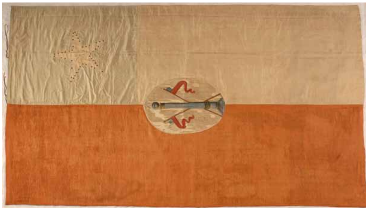
Foto 19. Faz A, después de la restauración.

con tubos fluorescentes que no emiten calor y con filtro UV. La luz es regulable y se ajustó a 50 LUX. El vidrio es de 160 mm de espesor, laminado y cuenta con filtro UV. La bandeja donde descansa la bandera es de aluminio y polietileno. Esta bandeja se forró con una tela de algodón, y sobre éste se colocó una tela de moletón, que actúa como antideslizante para el objeto.