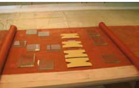
Foto 15. Aplicación de crepelina sobre el campo rojo.

Debido a la pérdida de urdimbre en el campo rojo, los hilos de trama al estar destejidos quedaron más largos que el ancho del campo, por lo que al ordenarlos presentaban cierta ondulación que se debió mantener para evitar una mayor deformación. Una vez ordenados los hilos sobre la tela de soporte, todo el campo se cubrió con una crepelina de seda teñida en el color del original. Esto se hizo con el fin de aplicar a todo el campo una cubierta protectora que evitara que los hilos se engancharan con la manipulación y que, por otra parte, no interfiriera visualmente con el original. La crepelina se fijó con hilo de seda del mismo color mediante puntadas equidistantes utilizando patrones de 10 cm x 5 cm. El original quedó encapsulado entre la tela de soporte y la crepelina.