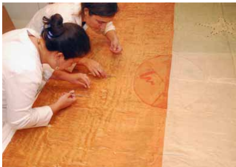
Foto 3. Detalle del campo blanco donde se observan puntadas de restauraciones anteriores.