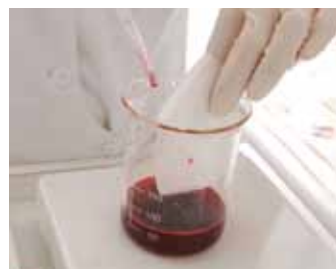
Foto 9. Pruebas de teñido para lograr los colores que se utilizarán para la restauración.