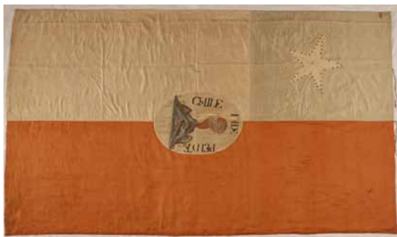
Foto 18. Faz B, después de la restauración.