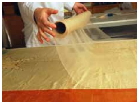
Foto 17. Aplicación de crepelina sobre el campo blanco de la faz A.