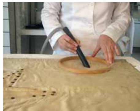
Foto 6. Limpieza por microaspiración.

Debido al alto grado de friabilidad y pulverulencia que presentaban los escudos, se hizo imposible la intervención utilizando aguja, puesto que al ser introducida, se