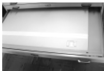
Foto 16: Carpeta Jumbo en cartón Crescent con bisagras de tela para facilitar su apertura.

los dibujos fueron sometidos a una limpieza superficial con brocha y borrador en migas.