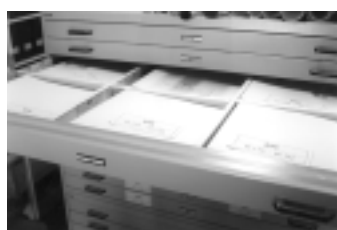
Foto 15: Almacenamiento de los dibujos en carpetas y planeras.